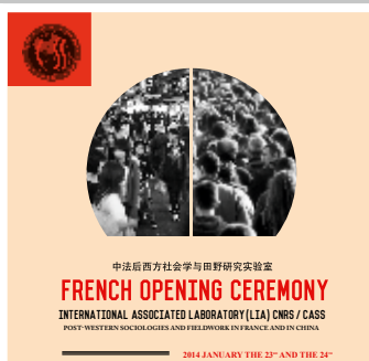
Laboratoire international associé de sociologie, France/Chine