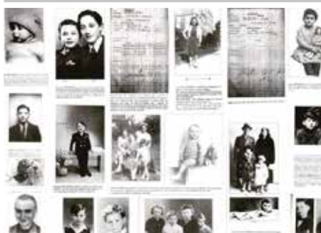
Exposition sur la déportation des enfants juifs de Paris