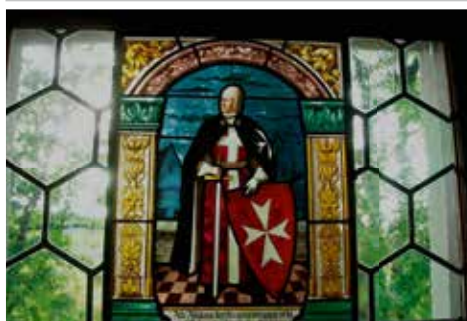
Commanderie de Bubikon