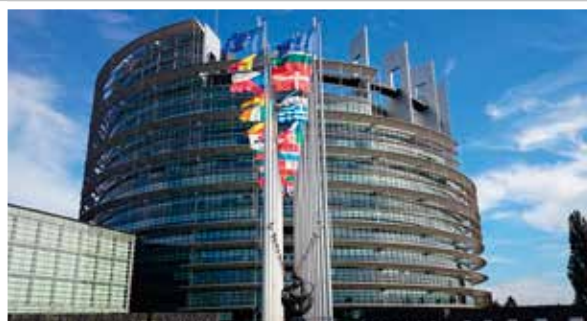
Parlement européen de Strasbourg