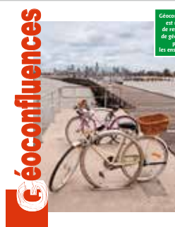
Site de ressources Géoconfluences