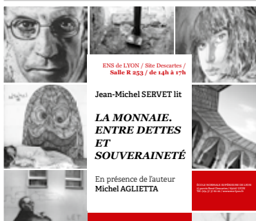
Analyse économique et politique