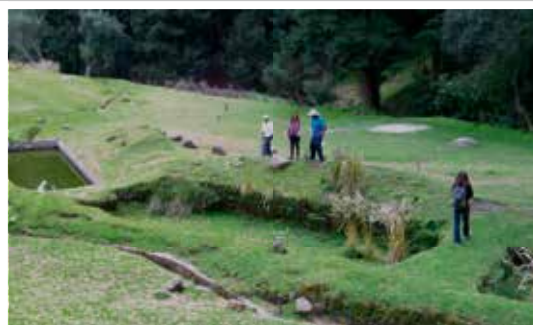
Voyages d'études, Mexique