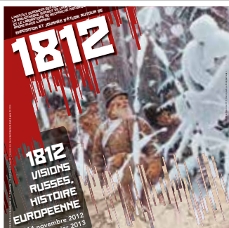
Journée d'études sur 1812, la campagne de Russie